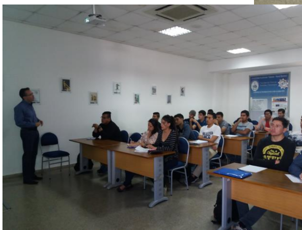
Reunión Convenio SIEMENS