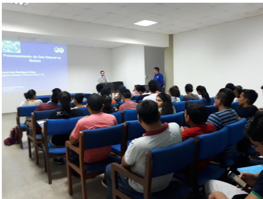
Conferencia sobre "Procesamiento de Gas en Bolivia"

Adicionalmente en el auditorio de la videoteca tuvimos talleres, conferencias.