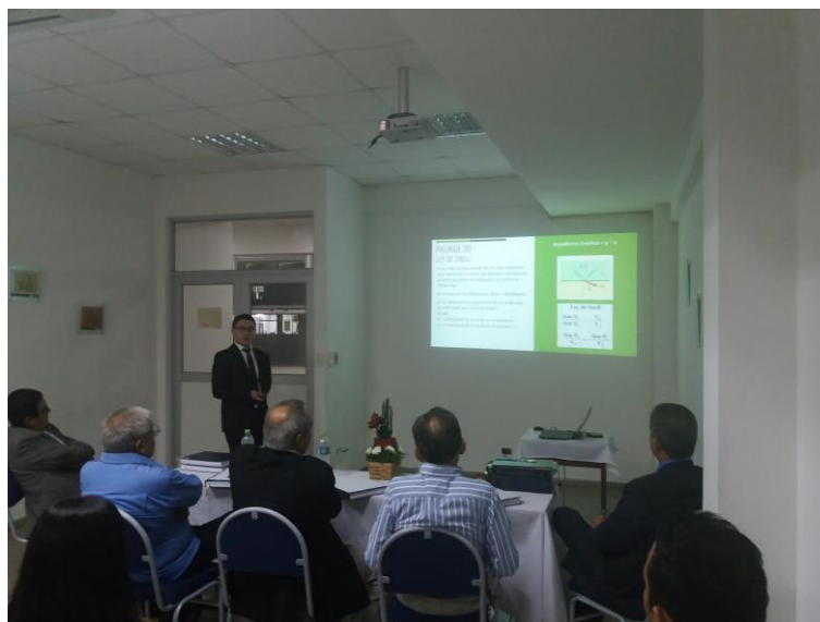
Defensa de tesis

Este año el sistema reporta 419 actividades en las salas de estudio de estudio grupal, defensa de tesis, talleres, reuniones y otras del quehacer académico: