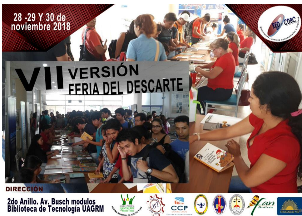
La Feria en las Instalaciones de la BT