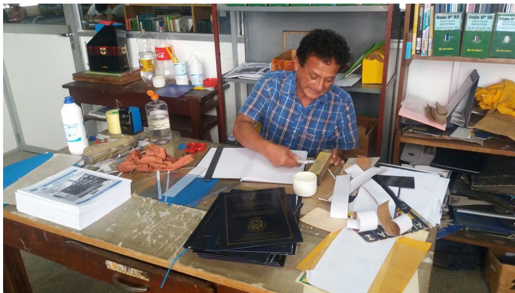
RELACIÓN DEL TRABAJO EN ENCUADERNACIÓN 2018

El trabajo de encuadernación de libros es sostenido, con el propósito de alargar la vida útil de los libros. También utilizamos material reciclado adicional al material compra la facultad esto con el fin de abaratar costos. Este año se encuadernaron y empastaron 551 libros .