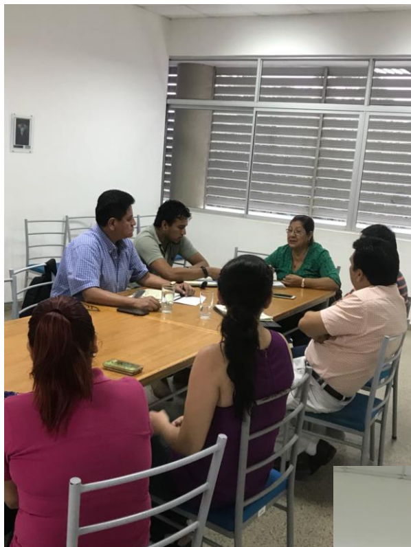
Reunión preparatoria acreditación Carrera Ing. Industrial