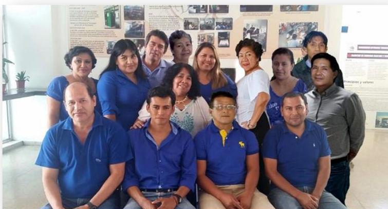
Funcionarios Gestión 2010