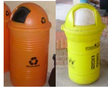
Foto 13 CONTENEDOR PARA PLÁSTICOS (NARANJA: BOTELLAS DE SODA / AMARILLO: OTROS PLÁSTICOS)