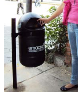
Foto 11 CONTENEDOR PARA PASILLOS Y ÁREAS DE CIRCULACIÓN PEATONALES