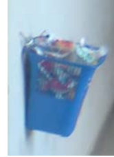
Foto 11 CONTENEDOR PARA PASILLOS DE AULAS

Otra opción para los contenedores: Basureros diferenciados (EMACRUZ): 1 par por piso (Solicitar su provisión)