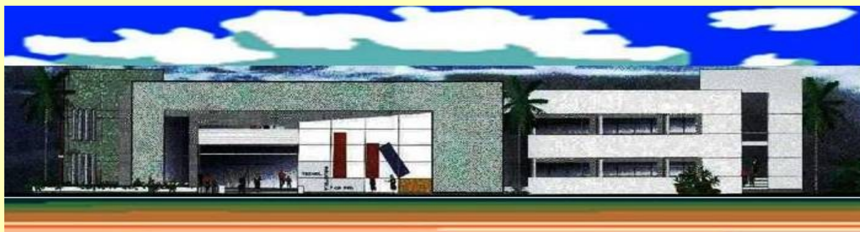
Diseño de Fachada principal del edificio de la nueva Biblioteca Central de Tecnología

Siguiendo la política diseñada por la Facultad, para aprovechar adecuadamente los recursos del IDH y responder con obras a las demandas presentes y futuras se aprobó ya el 2006 el proyecto de construcción del edificio de la Biblioteca y el 2007 se aprobó su implementación y equipamiento todo en fase de ejecución actual.